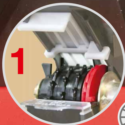
Normál méretű mag