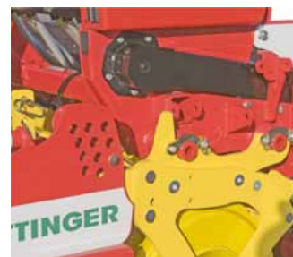
Rögzítőcsapot behelyezve – a vetőgép biztosítva.