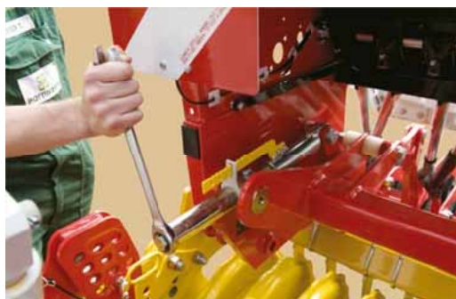
Könnyű hozzáférhetőség, központi mélységállítás