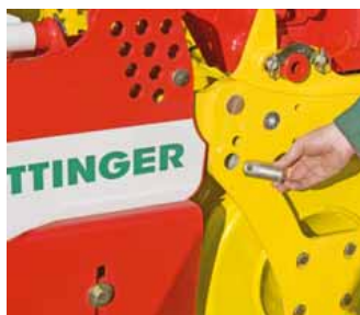
A rögzítőcsap kivéve – paralelogramma függesztés.