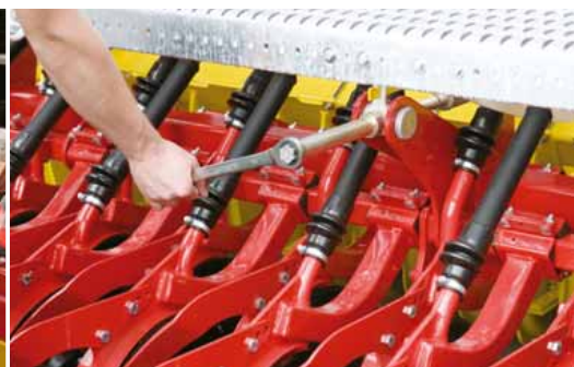
Központi csoroszlyanyomás állítás – 50 kg csoroszlya nyomásig.