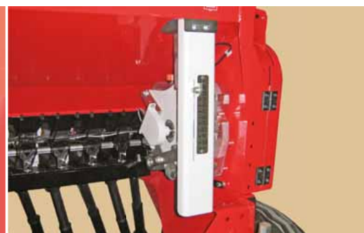
Elektromos vetés-mennyiség állítás