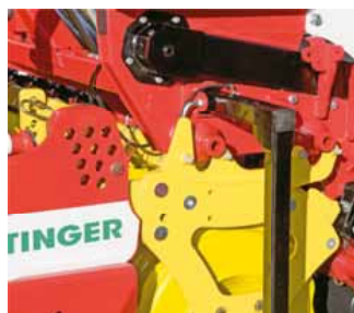
A vetőgép hátul halad – forgóborona kiemelve.