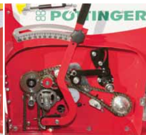
Vetőmag mennyiség beállítás