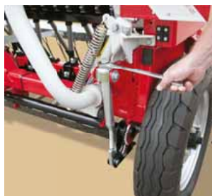
Központi csoroszlyanyomás állítás