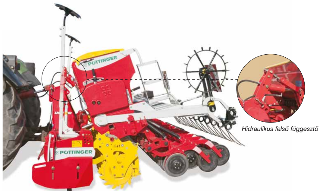
Hidraulikus felső függesztő

Kompakt egység – a súlypont közel helyezkedik el a traktorhoz.