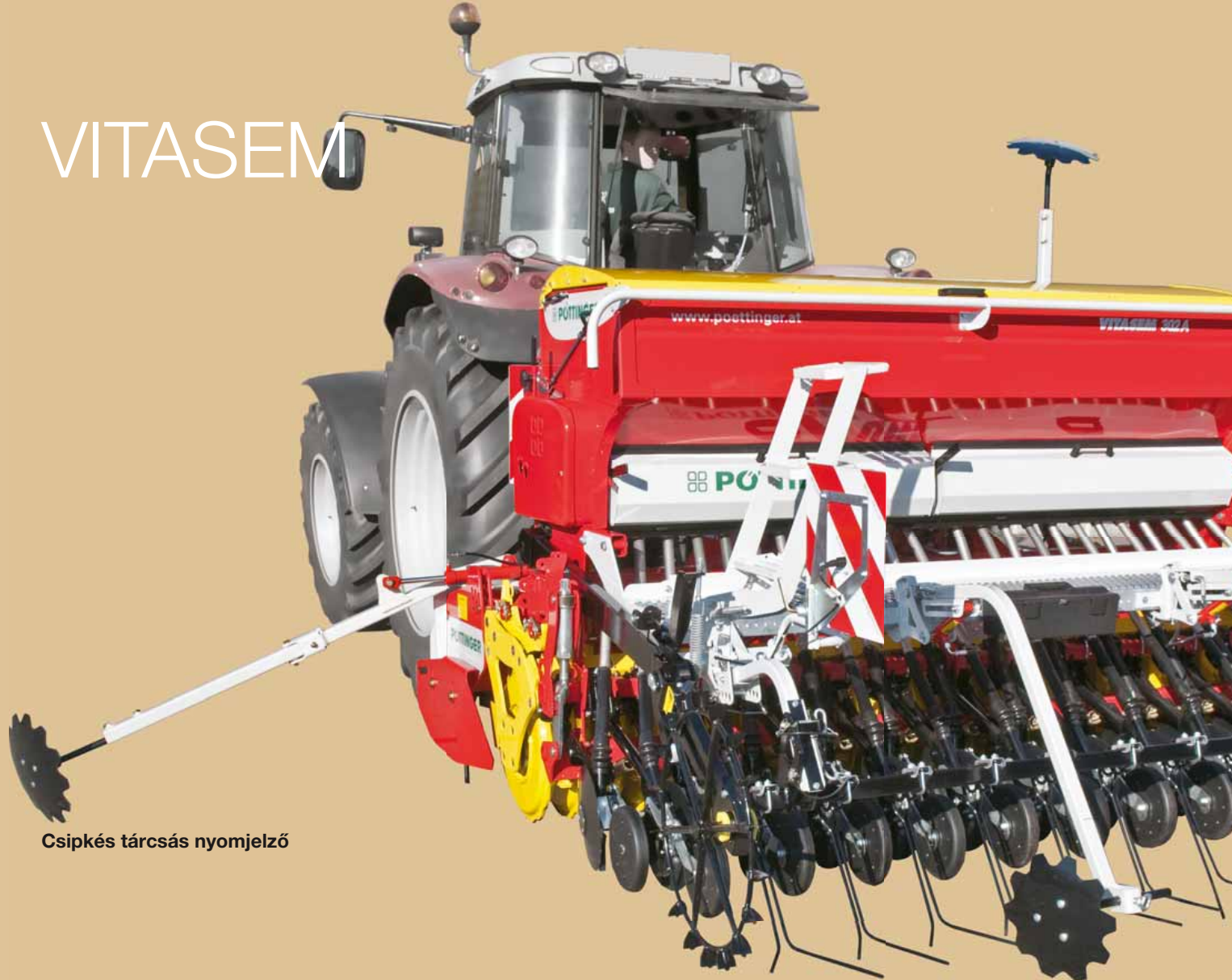
Csipkés tárcsás nyomjelző